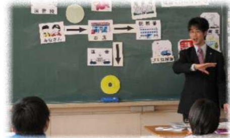
小学生の皆さんに一番身近な税金、消費税のしくみについて勉強しました。(小学校)

「税金の正しい使い道ってなんですか？」当日実際に出た質問です。皆さんは答えられますか？(小学校)